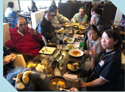
なかなかお出かけできない方が、 喜んでくれました♪