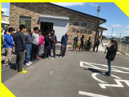
点呼では大きな声で返事！ みんな真剣に取り組んでくれました。

毎年4月に実施する避難訓練。今年は火災が発生し 避難する訓練をしました。Hさんが大きな声で「火事 だ〜」とみんなに知らせてくれました。避難経路の 確認もしました。災害時は靴を履き替えず避難しまし よう。