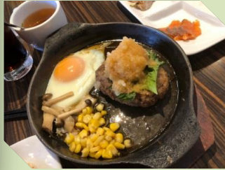
メイン料理は好きなものを 注文