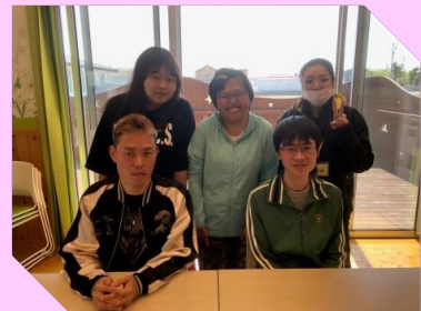
話が盛り上がり、気づいたら3時間も 過ぎていましたね(笑)