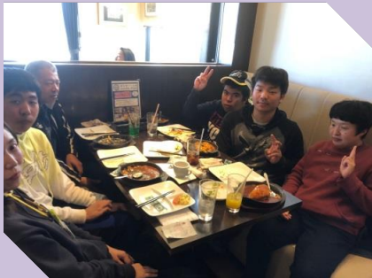
うちあげ開始ギリギリまで、施設外就労先で お仕事頑張りました！お疲れ様です。