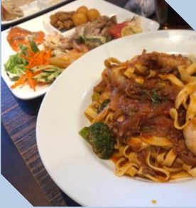
おしゃれな料理をお皿に。 ピュッフェランチ〜♪